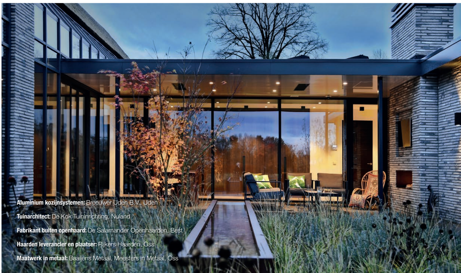
Aluminium kozijnsystemen: Breeuwer Uden B.V., Uden