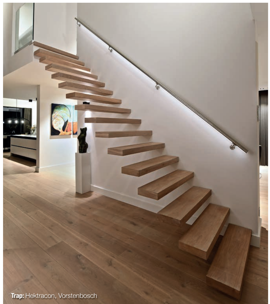
Trap: Hektracon, Vorstenbosch

ontwerp, maar door onze ideeën goed te onderbouwen hebben we ze volledig mee kunnen krijgen in onze denkwijze en daardoor ook enkele vernieuwende elementen kunnen toevoegen. De ruimtelijkheid hebben we bijvoorbeeld vooral in de diepte gezocht. Hierdoor hebben we de woning beter kunnen laten integreren in haar omgeving en daarbij optimaal gebruik kunnen maken van het weidse uitzicht.”