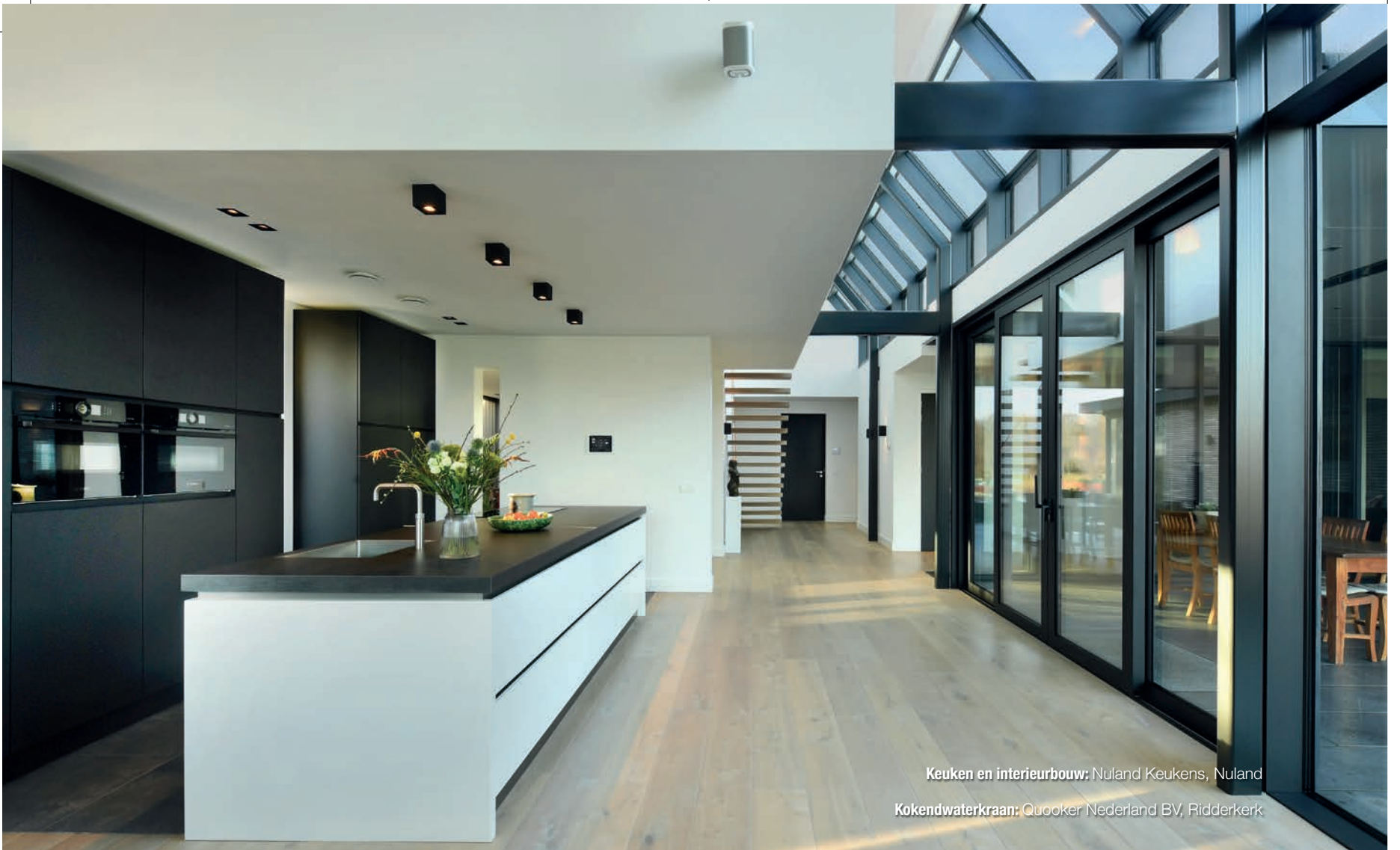
Keuken en interieurbouw: Nuland Keukens, Nuland Kokendwaterkraan: Quooker Nederland BV, Ridderkerk

De villa is gelegen aan een hoofdweg in een Brabants dorp, maar daar is in de woning zelf weinig van te merken. De prachtige villa is namelijk volledig georiënteerd op de schitterende omgeving achter het huis: een groen landschap dat overgaat in een wandelgebied en op ieder moment van de dag en in elke weersomstandigheid zorgt voor een uniek plaatje. “We kenden deze bijzondere plek al best lang”, vertellen de bewoners wanneer we gastvrij worden ontvangen in de woning. “Jarenlang stond hier een bungalow van familie van ons. We hebben altijd tegen elkaar gezegd: als we ooit de kans krijgen, dan willen we hier graag willen wonen. Enkele jaren geleden konden we de grond kopen. We hebben toen ook de kavel achter het huis gekocht, waardoor we opeens heel veel ruimte hadden. Die ruimte wilden we goed benutten door een nieuwe woning te realiseren.”